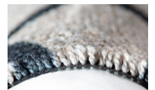
100% PET Recycling